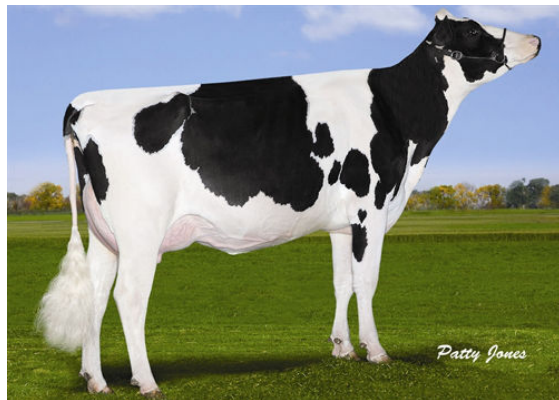
GEN-I-BEQ SNOWMAN SPRING